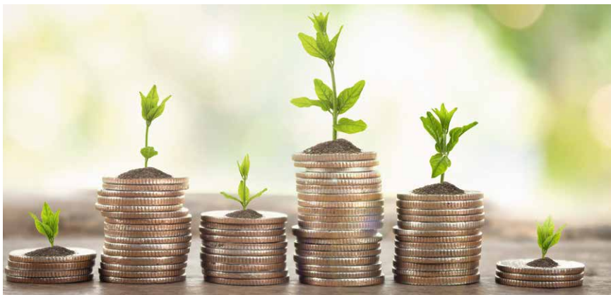
Der Markt für nachhaltige Anlagen wächst ständig.

Hinweise: Die Inhalte dieses Beitrags stellen keine Handlungsempfehlung dar, sie ersetzen weder die individuelle Anlageberatung durch die Bank noch die individuelle qualifizierte Steuerberatung. Bitte beachten Sie, dass es sich hierbei um mögliche Prognosen und Szenarien handelt. Sie sind kein Indikator für die Zukunft und keine Handlungsempfehlung zum Kauf eines Produkts. Als Grundlage dienen sowohl Informationen aus eigenen oder öffentlich zugänglichen Quellen, die für zuverlässig gehalten werden, als auch Informationen unseres Verbundpartners Union Investment.