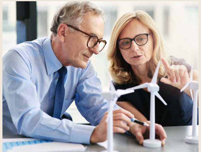
Nachhaltige Investments rücken bei Anlegern in den Fokus.

Viele Anleger in nachhaltige Fonds legen in erster Linie Wert auf soziale, ethische und ökologische Aspekte. Dabei gilt es zu beach-